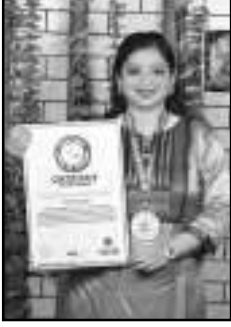
ચિ. અ.સૌ. ઝંખના