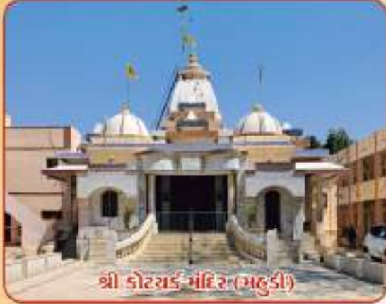
શ્રી કોટયક મંદિર (મહુડી)

કોટયક મંદિર (મહુડી) ખાતે છપ્પનભોગનાં મનોરથી તા.૧૧-૦૧-૨૦૨૫, સમય : બપોરે ૩:૦૦ થી ૬:૩૦