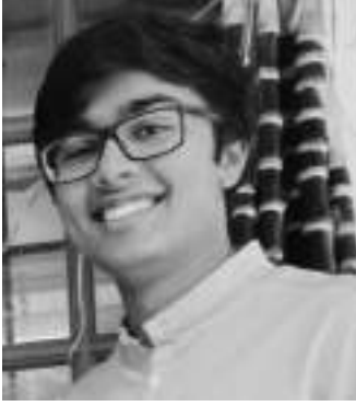
ચિ. ડૉ. નમ્ર (M.B.B.S.)